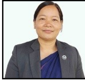
मा. बेलीमैया घले