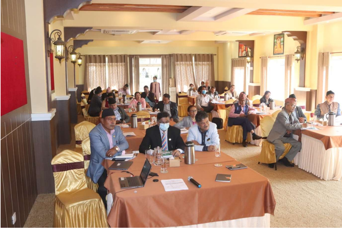
प्रदेश मन्त्रालयगत व्यहोरामाथिको कार्यपत्र प्रस्तुती